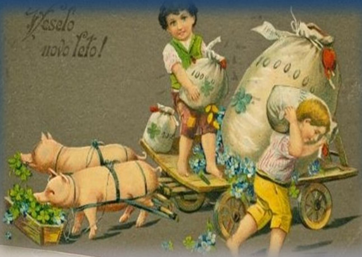
Voščilnica iz preloma stoletja z tipično motiviko. V novem letu bo obilo dobrega.