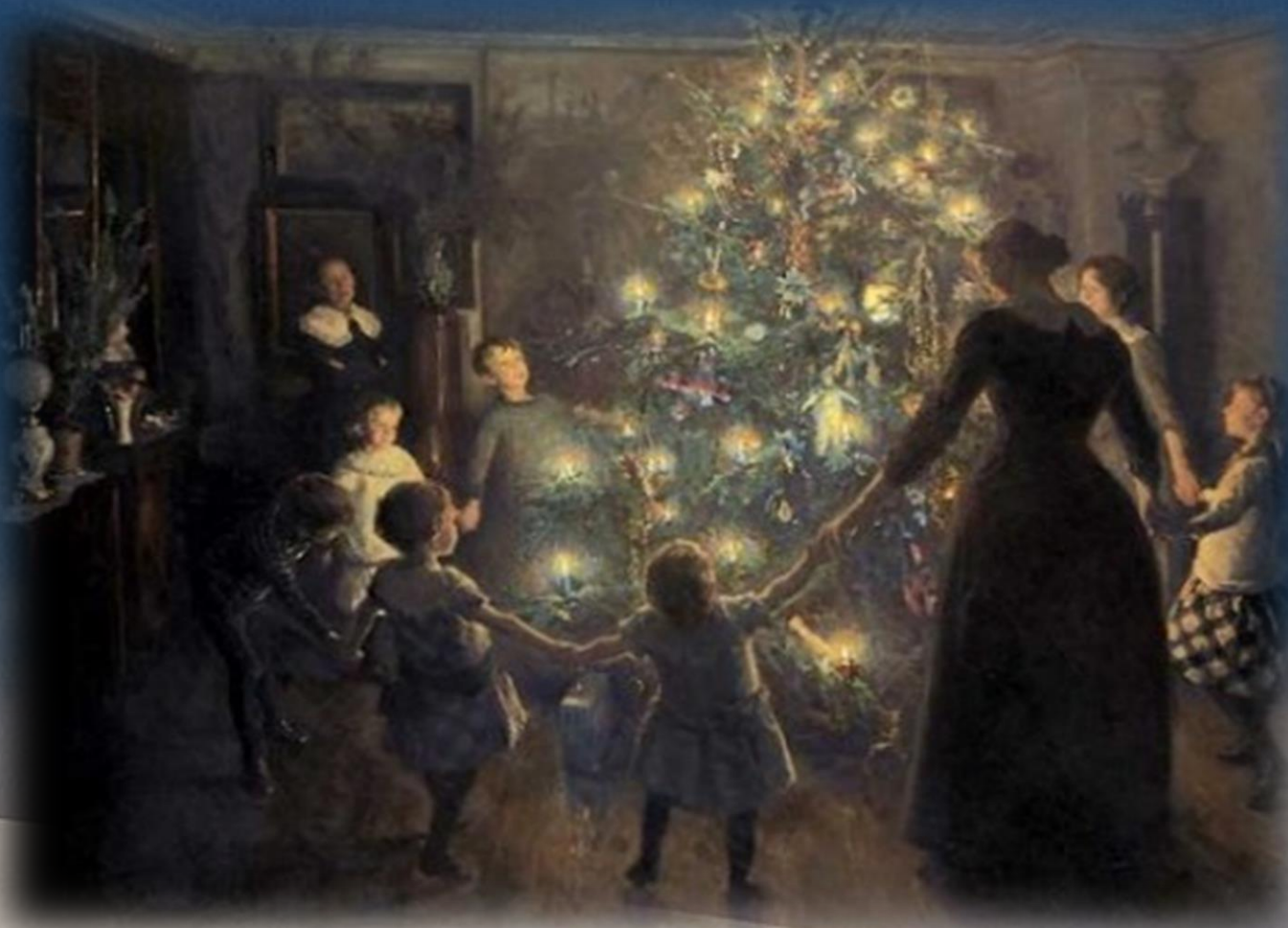
Johansen Viggo: Happy Christmas, 1891.