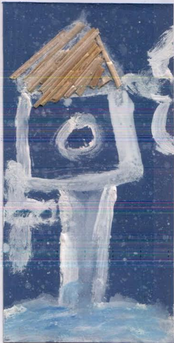
GAŠPER ZABUDOVŠEK, 2.b