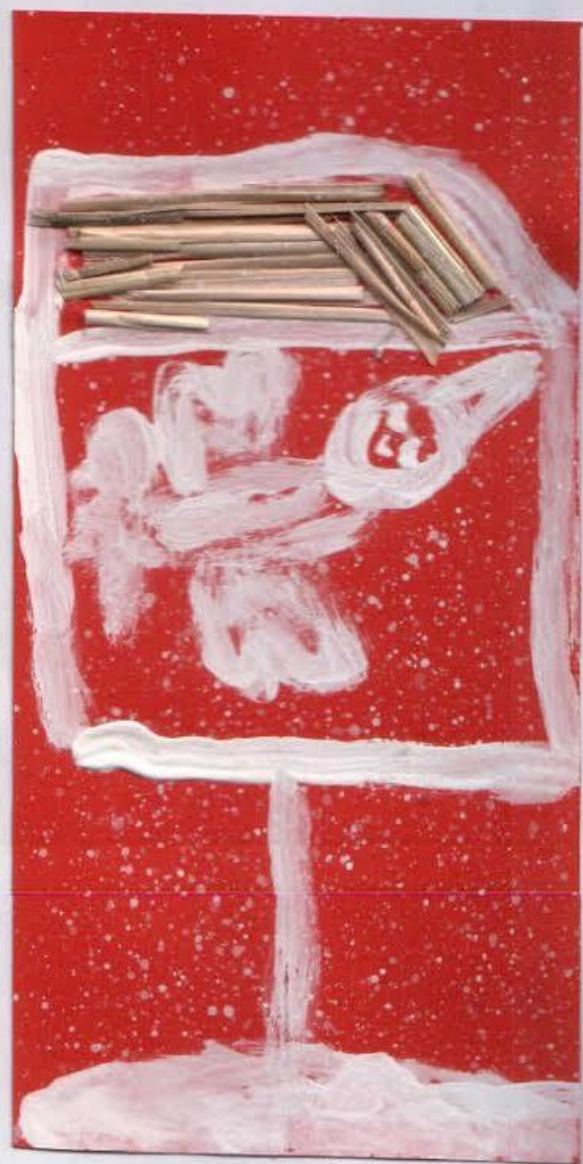
NUŠA HLAKAR, 2.b