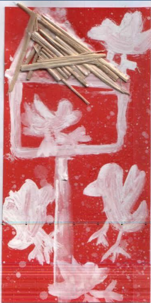
NEŽA PUŠNIK, 2.b