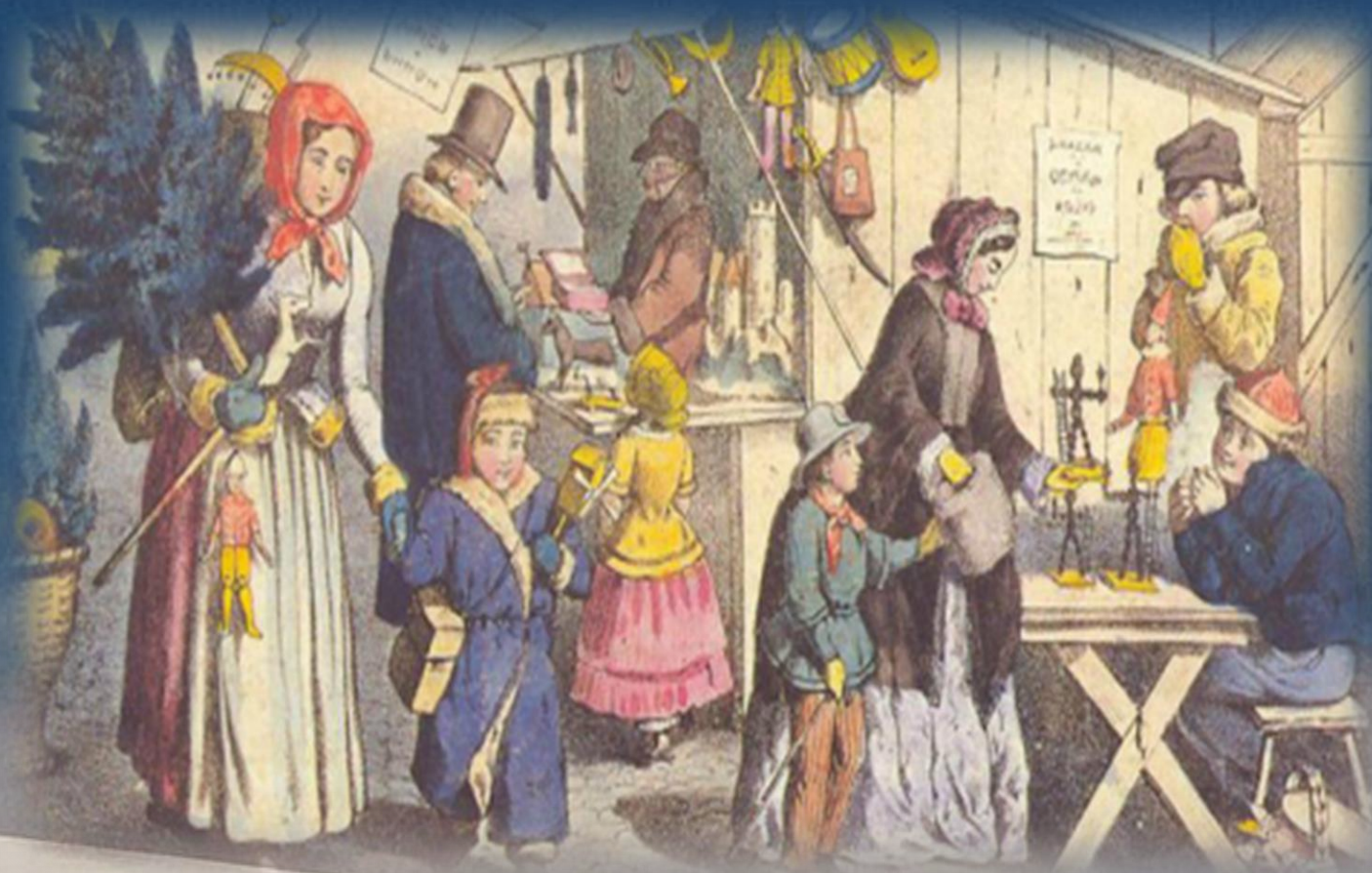
Božična tržnica v Nurenbergu druga polovica 19. stoletja