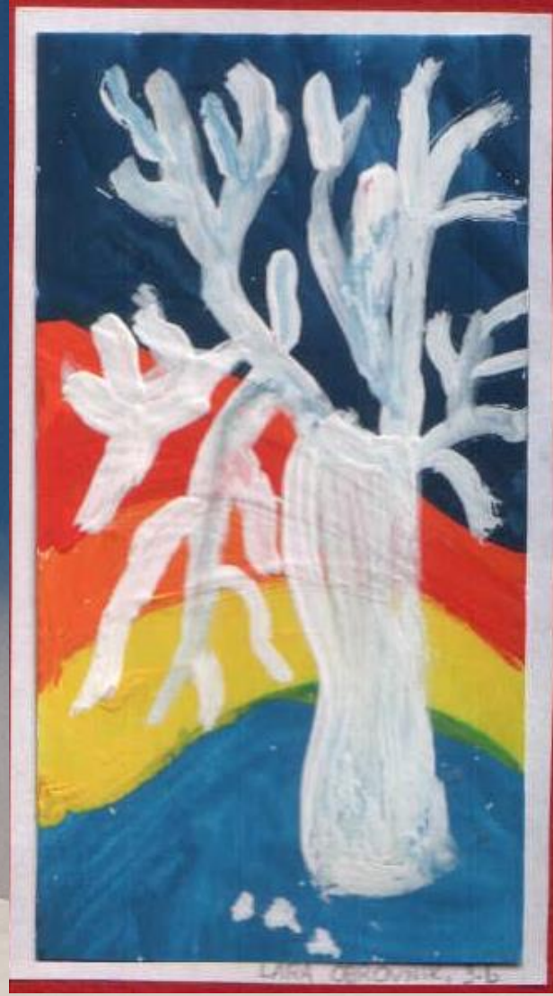
LILIA OBRUČNIK, 5-6