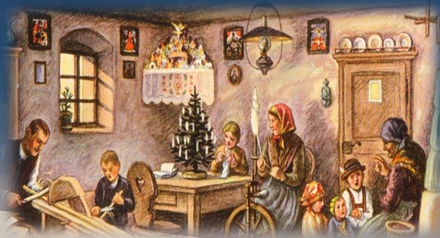
Maksim Gaspari: Družina med božičnimi prazniki